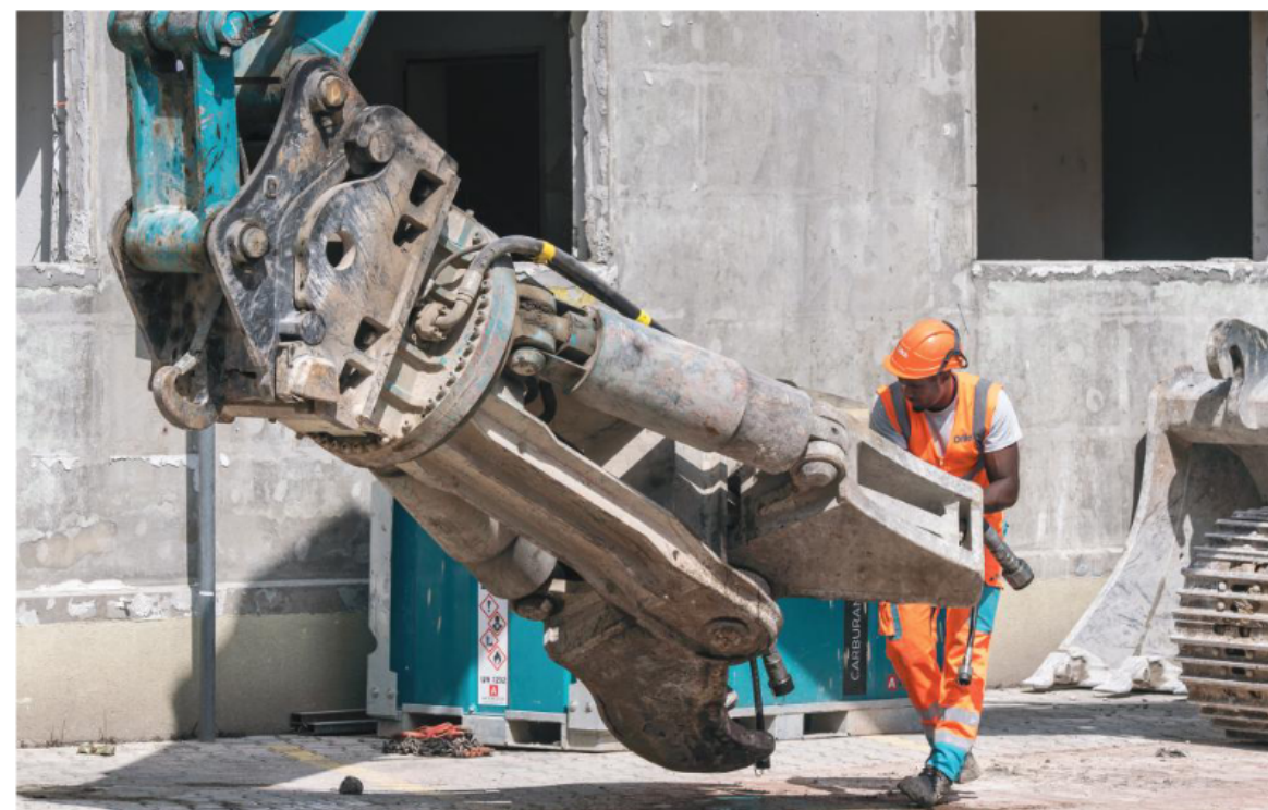
"Au chevet de la mâchoire d'acier" 5 septembre 2022 – Thierry Winkler

"Le Campus Pictet de Rochemont est un imposant projet de construction. Cette image illustre bien les différents acteurs présents sur un tel chantier. Elle met en lumière le gigantisme des machines qui sont nécessaires à l'accomplissement des différentes étapes de la réalisation et la taille modeste de l'humain, qui est à la fois le maître d'ouvrage et la ressource indispensable au bon déroulement de cette entreprise. Pour terminer, on aperçoit sur l'image les anciens bâtiments qui vont céder leur place au nouveau complexe, et ainsi ouvrir un nouveau chapitre dans l'histoire de ce quartier."