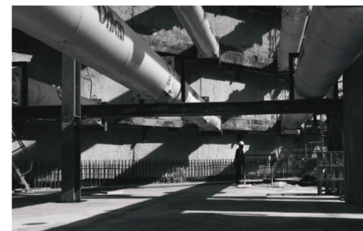
"L'ouvrier de l'ombre", 17 mars 2023 – Thomas Cassoudesalle

"Le Campus Pictet de Rochemont est un imposant projet de construction. Cette image illustre bien les différents acteurs présents sur un tel chantier. Elle met en lumière le gigantisme des machines qui sont nécessaires à l'accomplissement des différentes étapes de la réalisation et la taille modeste de l'humain, qui est à la fois le maître d'ouvrage et la ressource indispensable au bon déroulement de cette entreprise. Pour terminer, on aperçoit sur l'image les anciens bâtiments qui vont céder leur place au nouveau complexe, et ainsi ouvrir un nouveau chapitre dans l'histoire de ce quartier."